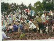
山のえいようを 海に流す