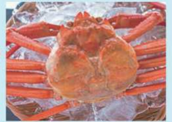
▲写真はイメージです