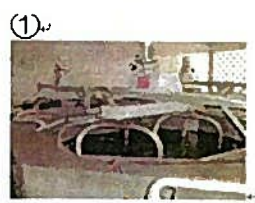
① かくはんタンク しせんな 海水