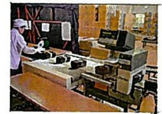
きんぞくたんちき