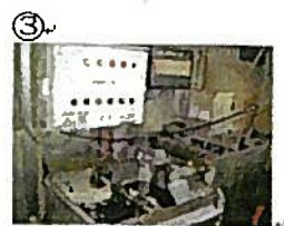
③ いぶつじよきよ① チェック