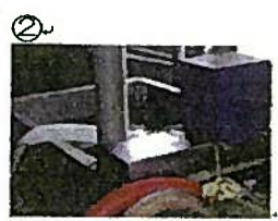
② 水あらい 水道より きれいな水