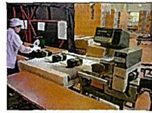
きんぞくたんちき