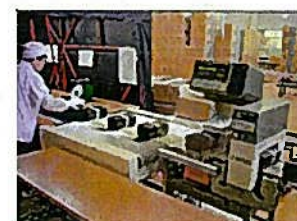
きんぞくたんちき