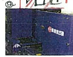
⑨ 4回目 いぶつじよきよ② ゴミニ