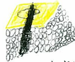
た た お お の の お お す す し