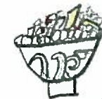
ち ち ら ら お お し