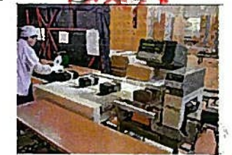
⑬ きんそくたんちき