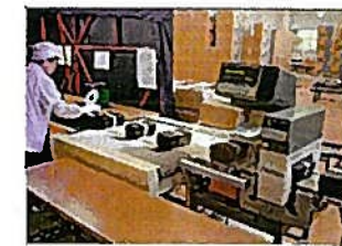
きんそくたんちき