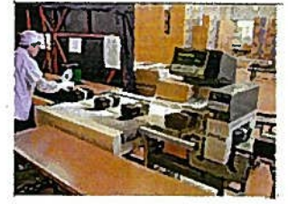
きんそくたんちき