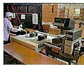
きんぞくたんちき