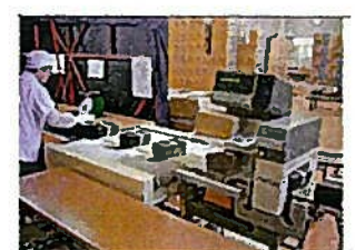
きんぞくたんちき