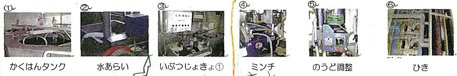
① かくはんタンク ② 水あらい ③ いぶつじよきよ① ④ ミンチ ま水 ⑤ のうど調整 ⑥ ひき