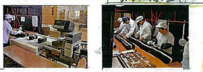
きんそくたんちき けんさ場へ