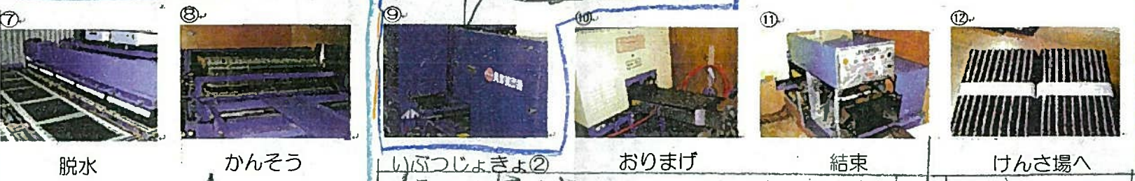
⑦ 脱水 ⑧ かんそう ⑨ いぶつじよきよ② ⑩ おりまげ ⑪ 結束 ⑫ けんさ場へ