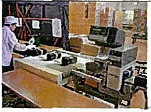
きんぞくたんちき