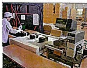
⑬ きんそくたんちき