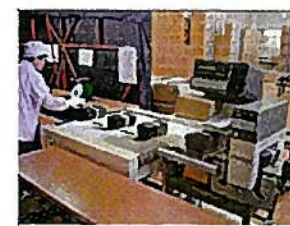
きんそくたんちぎ